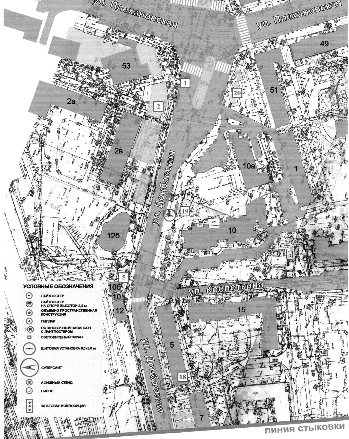
СХЕМА РАЗМЕЩЕНИЯ РЕКЛАМНЫХ КОНСТРУКЦИЙ НА ТЕРРИТОРИИ ГОРОДСКОГО ОКРУГА ГОРОД ВОРОНЕЖ ДЛЯ УЧАСТКА ТЕРРИТОРИИ: улица Донбасская М 1:1000