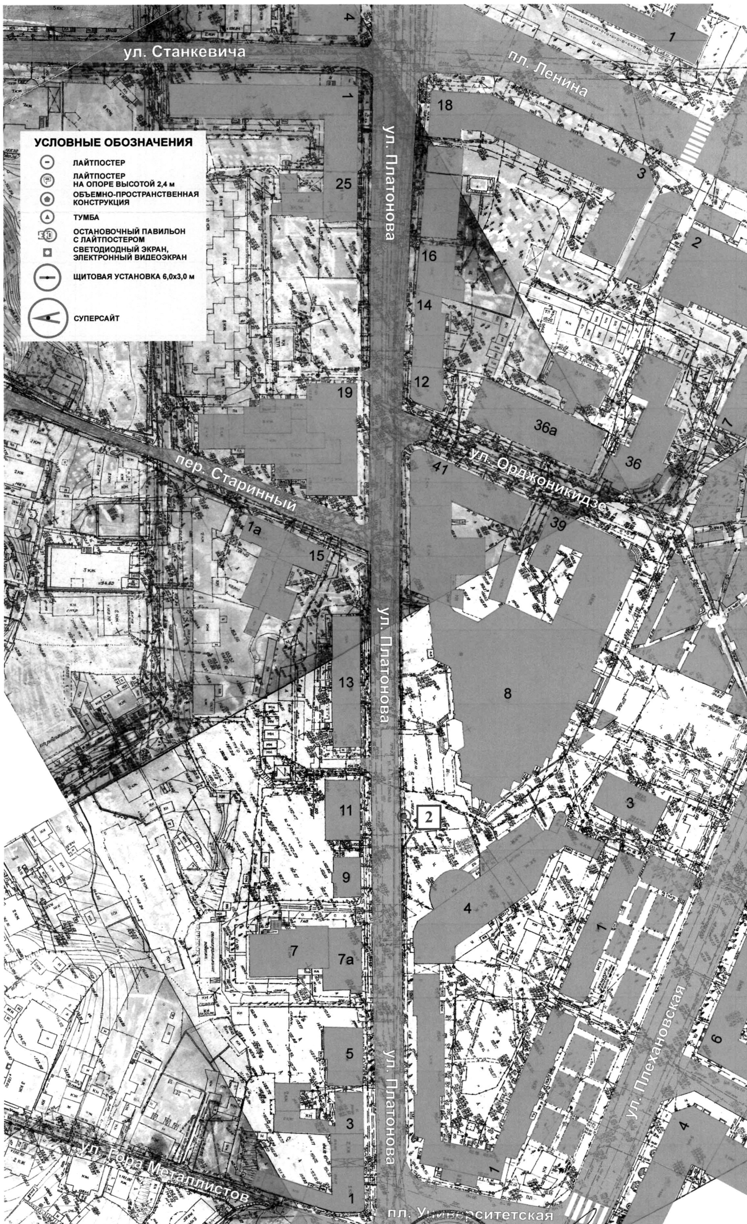
СХЕМА РАЗМЕЩЕНИЯ РЕКЛАМНЫХ КОНСТРУКЦИЙ НА ТЕРРИТОРИИ ГОРОДСКОГО ОКРУГА ГОРОД ВОРОНЕЖ ДЛЯ УЧАСТКА ТЕРРИТОРИИ: улица Платонова М 1:1000

Первый заместитель руководителя департамента имущественных и земельных отношений Воронежской области