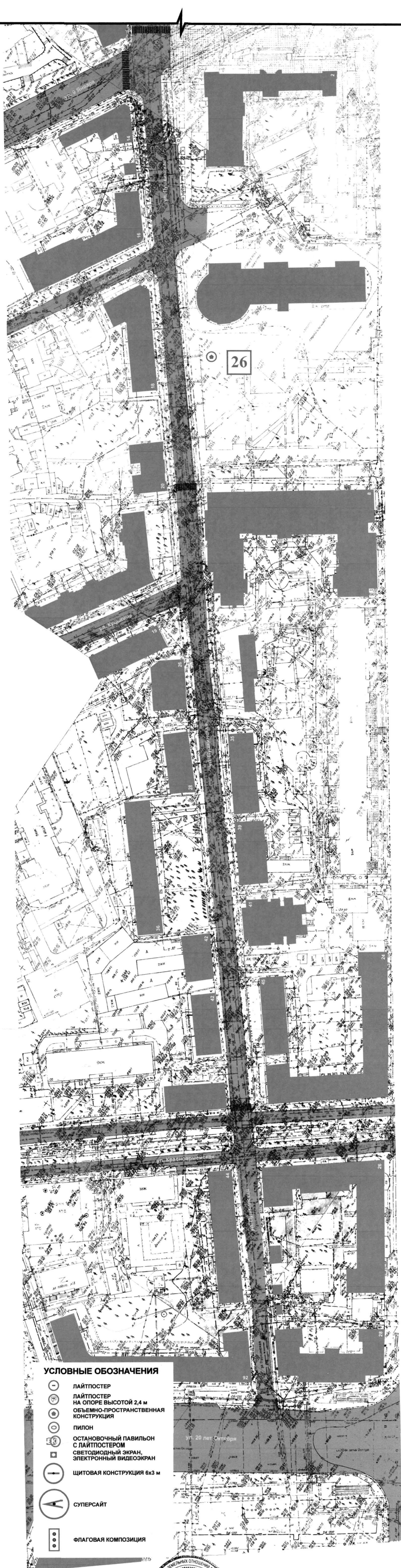
СХЕМА РАЗМЕЩЕНИЯ РЕКЛАМНЫХ КОНСТРУКЦИЙ НА ТЕРРИТОРИИ ГОРОДСКОГО ОКРУГА ГОРОД ВОРОНЕЖ ДЛЯ УЧАСТКА ТЕРРИТОРИИ: улица Пушкинская М 1:1000