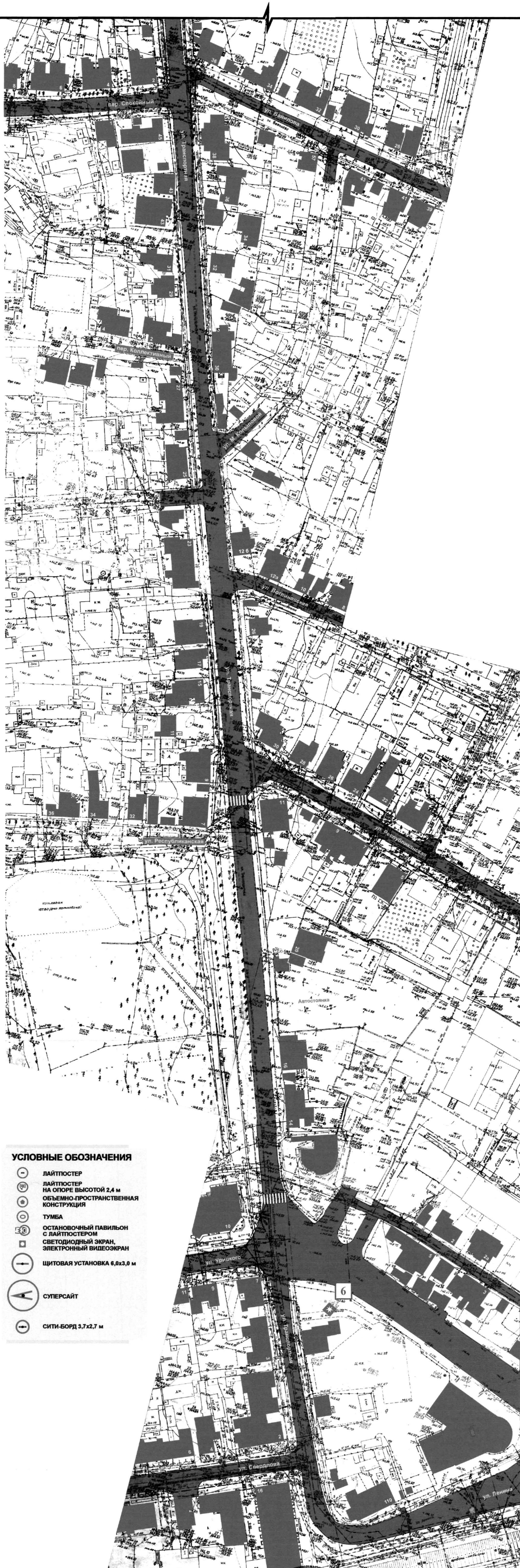
СХЕМА РАЗМЕЩЕНИЯ РЕКЛАМНЫХ КОНСТРУКЦИЙ НА ТЕРРИТОРИИ ГОРОДСКОГО ОКРУГА ГОРОД ВОРОНЕЖ ДЛЯ УЧАСТКА ТЕРРИТОРИИ: улица Транспортная М 1:1000