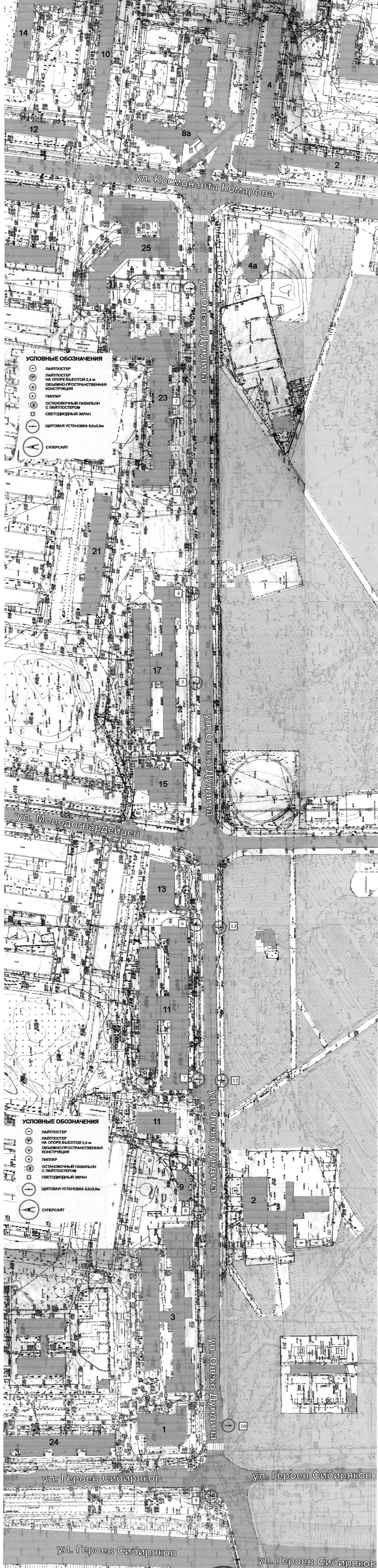
СХЕМА РАЗМЕЩЕНИЯ РЕКЛАМНЫХ КОНСТРУКЦИЙ НА ТЕРРИТОРИИ ГОРОДСКОГО ОКРУГА ГОРОД ВОРОНЕЖ ДЛЯ УЧАСТКА ТЕРРИТОРИИ: улица Олеко Дундича М 1:1000